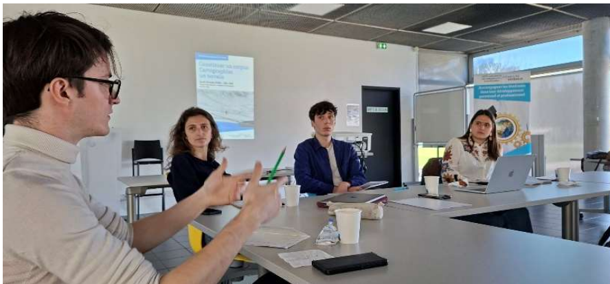
Séminaire doctoral 19 mars