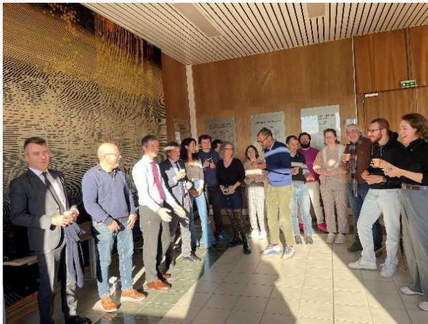
AG 21 janvier