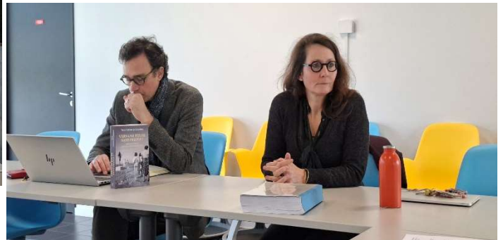
Séminaire IRM du 4 mars